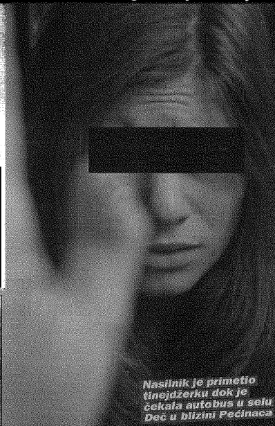
Nasilnik je primetio tinejdžerku dok je čekala autobus u selu Deča u blizini Pećinaca